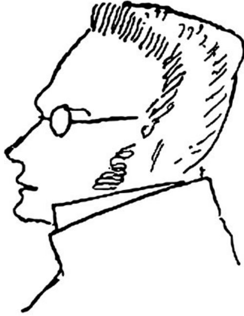
Vermutlich von Friedrich Engels aus dem Gedächtnis angefertigte Skizze