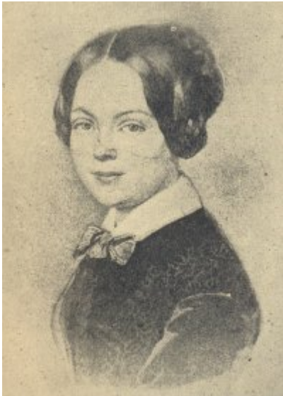
Jugendporträt von Marie von Dubský, spätere von Ebner-Eschenbach, um 1845

Burgtheater und gab ihr literarische Anregungen.