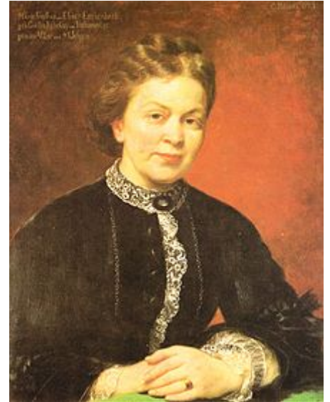
Karl von Blaas: Freifrau Marie von Ebner-Eschenbach, Öl auf Leinwand, 1873

Freifrau Marie Ebner von Eschenbach (* 13. September 1830 auf Schloss Zdislawitz bei Kremsier in Mähren als Marie Dubský von Třebomyslice ; † 12. März 1916 in Wien) war eine mährisch-österreichische Schriftstellerin. Sie gehört mit ihren psychologischen Erzählungen zu den bedeutendsten deutschsprachigen Erzählern des 19. Jahrhunderts.