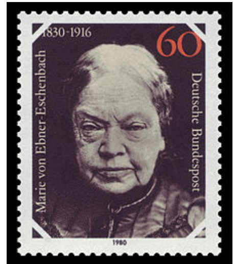
150. Geburtstag von Marie von Ebner-Eschenbach: Sonderbriefmarke der Deutschen Bundespost von 1980