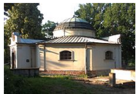
Das Familiengrab in Zdislavice

Marie von Ebner-Eschenbach starb am 12. März 1916 im Alter von 85 Jahren in ihrer Wohnung in Wien, Spiegelgasse 1 , und wurde in der Familiengruft der Grafen Dubský, in Zdislawitz , beigesetzt. Das Schloss Zdislawitz war lange Zeit dem Verfall preisgegeben, das Mausoleum vernachlässigt und es gab kein Andenken an die Dichterin. [8] Seit 2015 wird die Gruft mit dem anliegenden Park vom Czech National Trust renoviert und im Juni 2016 (anlässlich ihres 100. Todesjahrs) wurden Grab und Kapelle zugänglich gemacht. [9] Die Arbeiten zur Renovierung der Anlage und Errichtung eines Denkmals sollen bis 2020 abgeschlossen sein. [10]