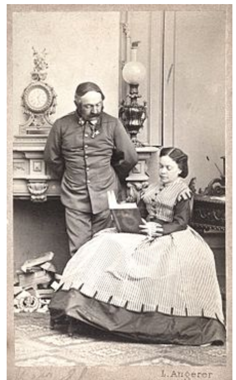
Marie von Ebner-Eschenbach mit ihrem Ehemann, um 1865

1856 zog sie dauerhaft nach Wien, wo sie 1879 eine Uhrmacher-Ausbildung absolvierte, was für eine Frau damals ungewöhnlich war. Sie sammelte Formuhren ; die Sammlung befindet sich im Uhrenmuseum in Wien. [2] Im Laufe der Zeit wandte sie sich ganz der Literatur zu. Während fast zwanzig Jahren schrieb sie Dramen (Gesellschaftsstücke und Lustspiele ), inspiriert von Friedrich von Schiller , die jedoch nicht erfolgreich waren. Nachdem sie sich mit wenig Erfolg als Dramatikerin betätigt hatte, konnte sie 1876 die Aufmerksamkeit mit ihrem ersten Kurzroman Božena , welcher in der Deutschen Rundschau abgedruckt worden war, auf sich ziehen. Sie versuchte sich nun als Schriftstellerin, was sich aufgrund des Erfolgs als gute Entscheidung erwies. Mit Werken wie den Aphorismen (1880) und den Dorf- und Schlossgeschichten gelang ihr schließlich der endgültige Durchbruch. Letztgenannte enthalten ihre bekannteste Novelle Krambambuli . Sie konzentrierte sich nun auf ihre erzählerischen Dichtungen, in denen